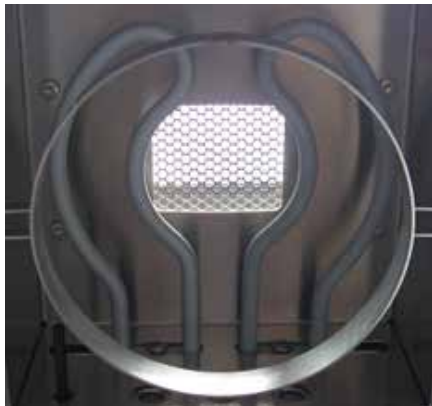
获红点设计大奖的AURI 加热源

借助其经过优化的加热元件——赛多利斯全新的AURI 合金加热源，MA160 可实现高速测量，与传统红外水分测定仪相比，测量时间缩短一半以上。而MA160 的称重系统也是由此来保证要求的精度。